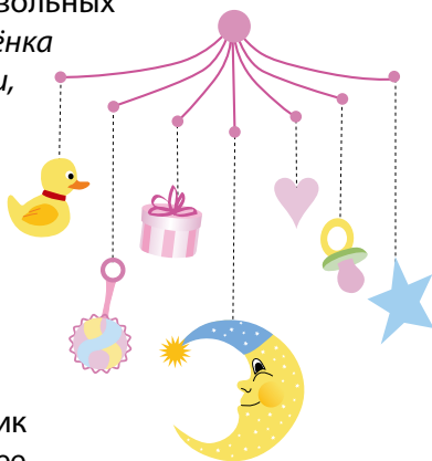
Возраст 0–3 месяца

4. Вместо мобиля можно использовать разноцветные летающие воздушные шары, наполненные гелием. Привяжите к руке ребёнка конец верёвочки от шарика. Покажите малышу, двигая его рукой, что он может заставить двигаться шарик. Можно на этом же шнурке, рядом с шариком, укрепить колокольчик или бубенчик. Это будет ребёнку ещё интереснее.