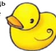
Возраст 0–3 месяца

6. Возьмите игрушку со сложной или бугристой поверхностью — такую, чтобы её было удобно схватить. Положите её на грудь ребёнка, соедините на ней обе его ручки. Вероятно, он её схватит. Хорошо, если игрушка будет издавать звук при сдавливании.